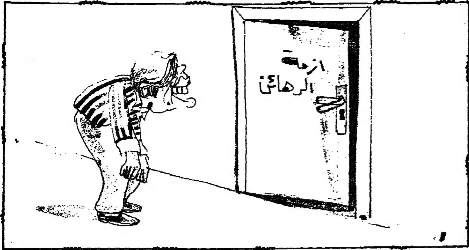
في مقابلة مع مجلة التايم الامريكية صادق قطب زاده:

ادخل على من بين زاده الشيباني مجموعة من الاسرى عرضهم على السيد فقال له بعضهم: اضطلع الله العير... نحن نراك وينا جرح وعطش فلا نجيب عننا الجوع والعطش واقتل نقر لهم بطعم وشراب ولا فرقة قتل احدهم: اضلع الله الامر... كما امرك ونحن لان اصابت عاقر ما تصنع باصباحك... فقال دعوتكم... فقال الرجل انها اجرو ما تجري اي يوم اشرف... اجرو ظفرك بنا ام يوم عوقنا... ماير لهم بقال وكسوة